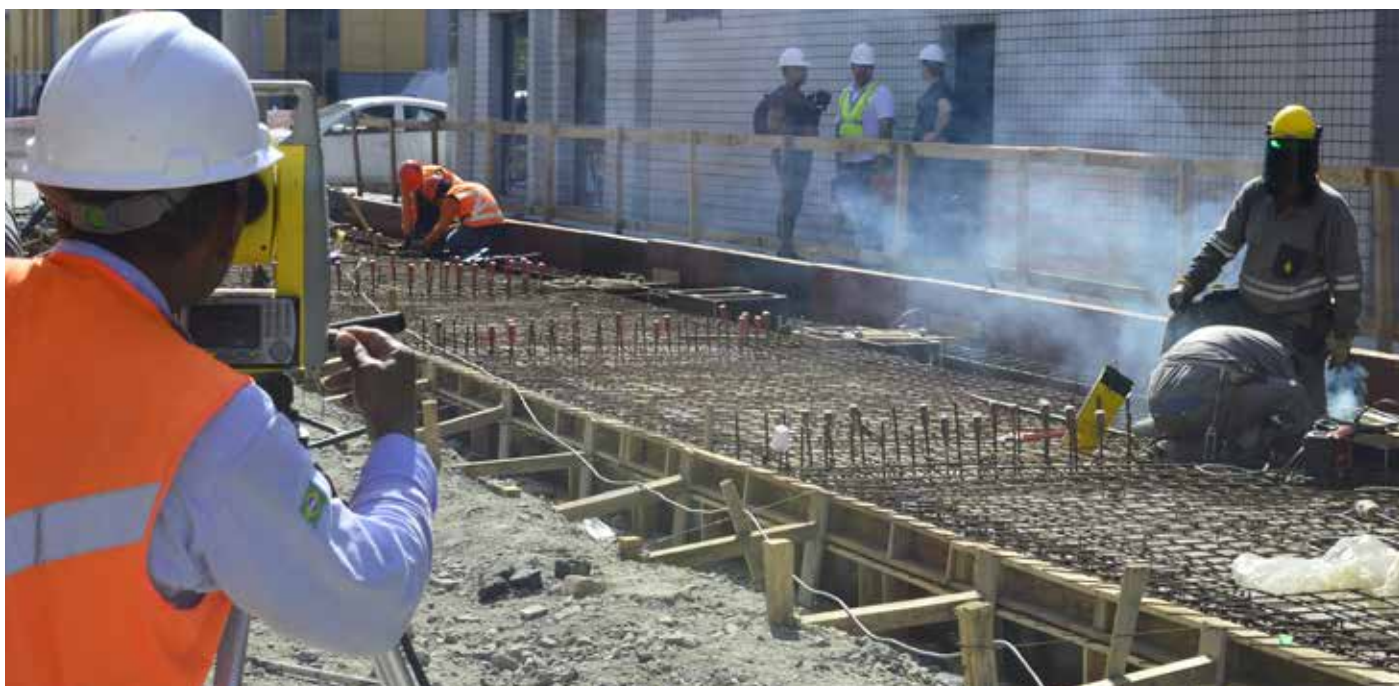
Trabalhadores nas obras de implantação da 2ª fase do VLT.

O QUE UM PROJETO DE MOBILIDADE URBANA, COMO O VLT DA BAIXADA SANTISTA, TRAZ DE BOM PARA A SOCIEDADE?