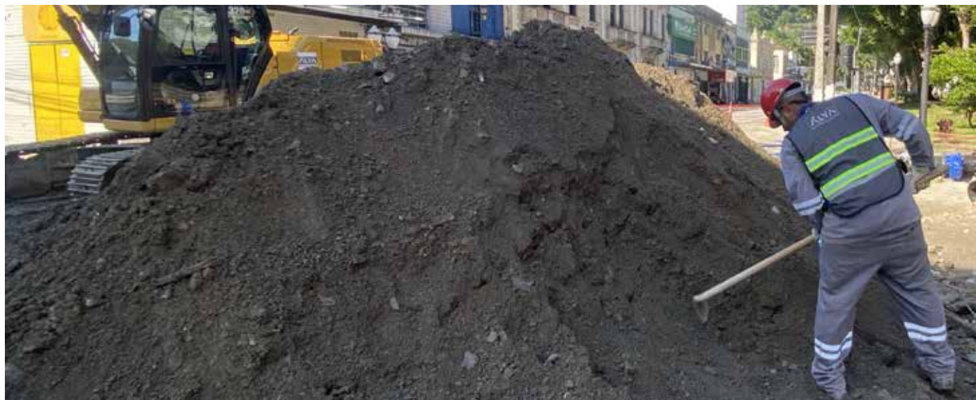
Equipe de arqueologia na obra da implantação do VLT da Baixada Santista.

Oikos - SANTOS É UMA CIDADE COM UMA HISTÓRIA RICA QUE REMONTA AO PERÍODO COLONIAL. AO LONGO DOS ANOS, A CIDADE ENFRENTOU O DESAFIO DA MODERNIZAÇÃO E URBANIZAÇÃO, O QUE MUITAS VEZES RESULTOU EM CONFLITOS COM A PRESERVAÇÃO DO SEU PATRIMÔNIO HISTÓRICO. PARA LIDAR COM ESSE DESAFIO, SANTOS TEM IMPLEMENTADO POLÍTICAS DE PRESERVAÇÃO DO PATRIMÔNIO,