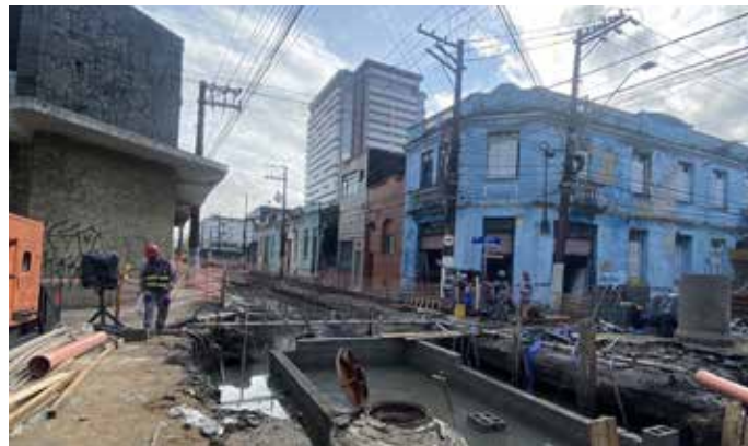
Equipe de arqueologia na obra da implantação do VLT da Baixada Santista.

ESSAS ETAPAS GARANTEM QUE OS RESQUÍCIOS HISTÓRICOS OU ARQUEOLÓGICOS ENCONTRADOS DURANTE O ACOMPANHAMENTO DAS FRENTES DE OBRA DO VLT EM SANTOS SEJAM DEVIDAMENTE TRATADOS E PRESERVADOS, CONTRIBUINDO PARA A PROTEÇÃO DO PATRIMÔNIO CULTURAL DA REGIÃO.